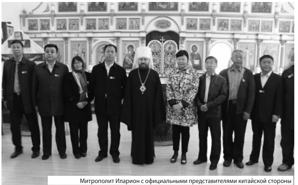
Митрополит Иларион с официальными представителями китайской стороны