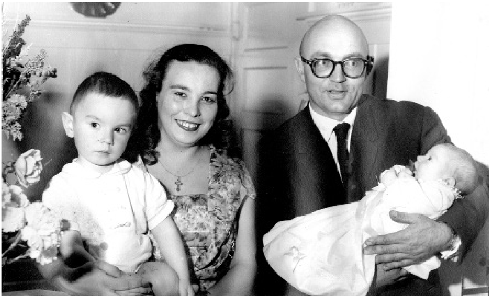
Крестины дочери, Сан-Франциско, 1962 г.

Я после школы закончила курсы черчения и работала в проектной компании Societe Marocaine D'etudes, которая состояла в основном