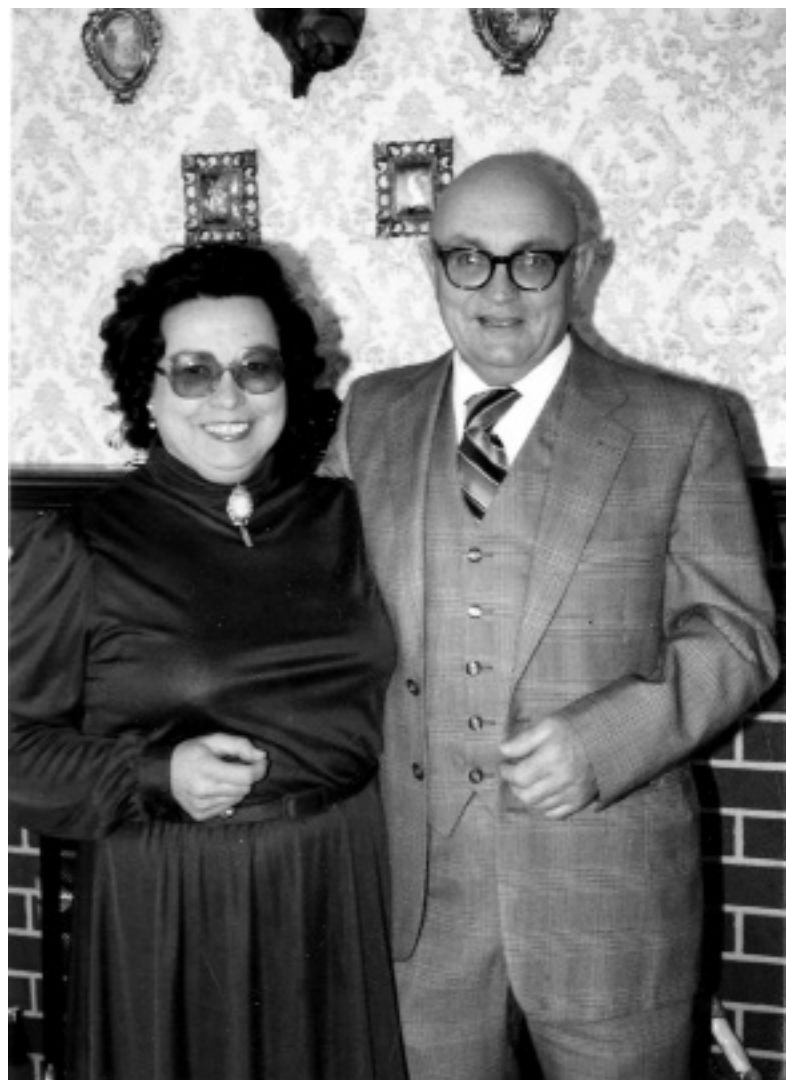
Всегда вместе. Дома, 1980 г.