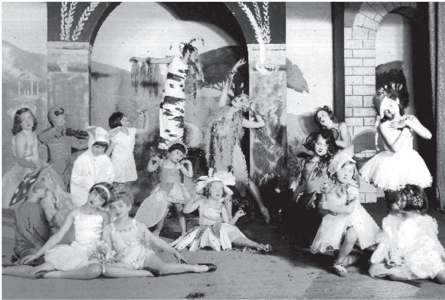
Третий День русского ребенка в Сан-Франциско, 1934 г.

В одной из статей об этом празднике отмечалось: «Было много чрезвычайно интересных номеров обширной программы, исполненных учащимися местных русских школ и деть-