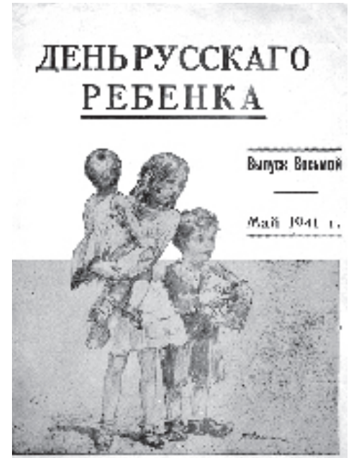
Обложка журнала «День русского ребенка». Рисунок Г. Ильина.

вые декорации вновь были бесплатно выполнены художником Н.Н. Першиным. Неизгладимое впечатление оставила у зрителей живая картина «Русь и ее народы», которая сопровождалась декламированием стихотворения «Молитва о России».