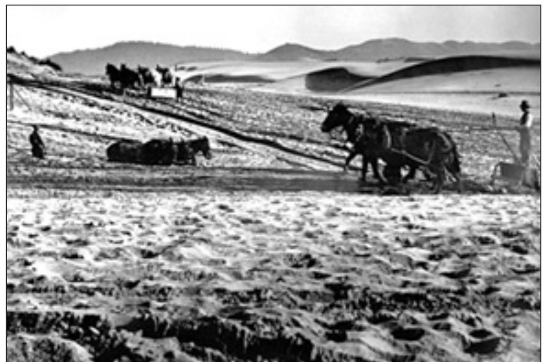
Так выглядела земля, которую осваивали братья Greene. Снимок – 1880