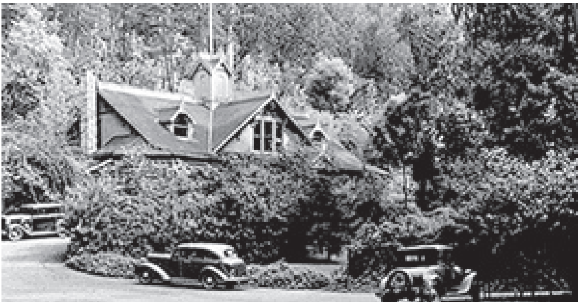
Гостиница Трокадеров, 1930 г.