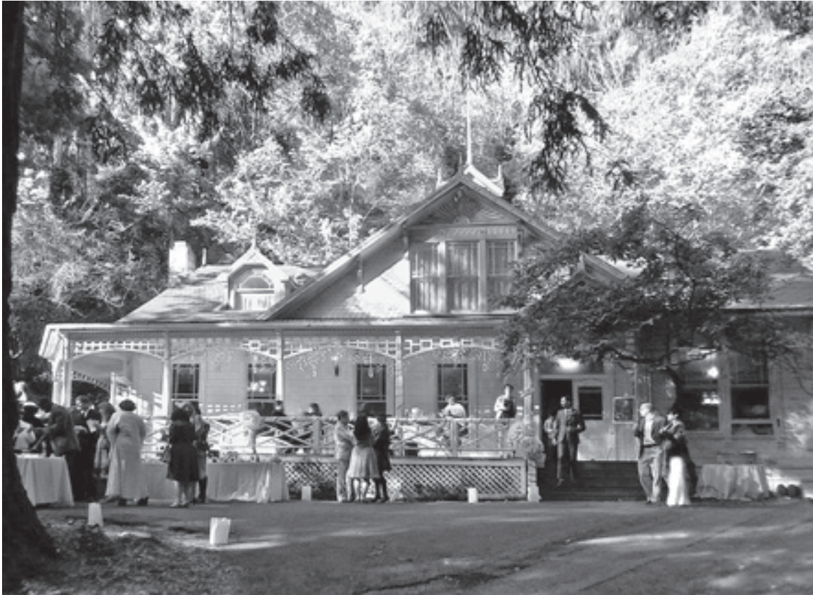
Свадебные церемонии в парке заказывают за год вперед. Stern Grove 7 октября 2012 г.