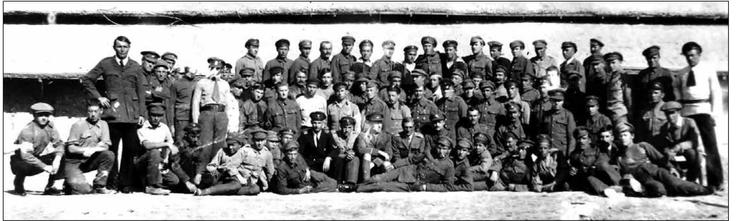
Надпись на обороте: «Группа морских офицеров и матросов, прибывших из английского лагеря в Месопотамии во Владивосток на «Франц Фердинанд» 23 сентября 1921 г. и зачисленных в списки Сибирской флотилии»