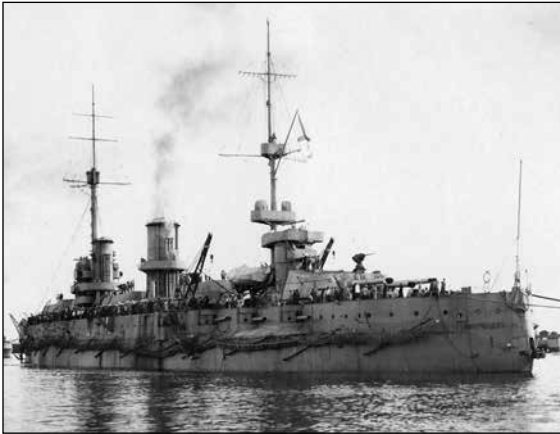
Линейный корабль «Императрица Мария», ок. 1916 г.