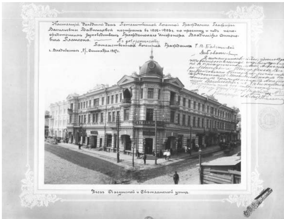
Дом Г. Бабинцевой. Светланская ул., Владивосток. МРК, США