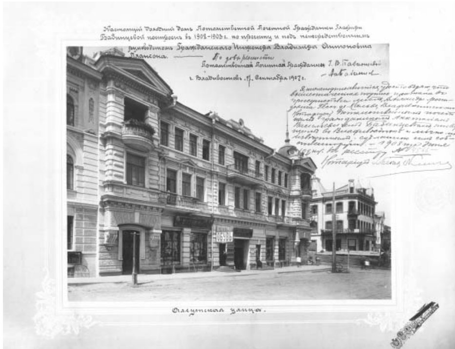
Дом Г. Бабинцевой. Светланская ул., Владивосток. МРК, США