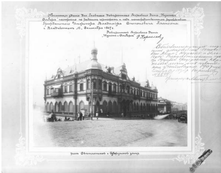
Здание торгового дома Кунста и Альберса. Светланская ул., Владивосток. МРК, США