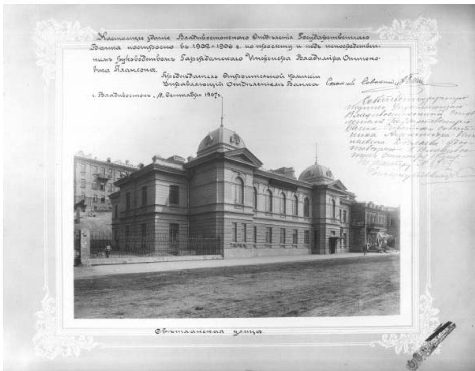
Государственный банк. Светланская ул., Владивосток. МРК, США