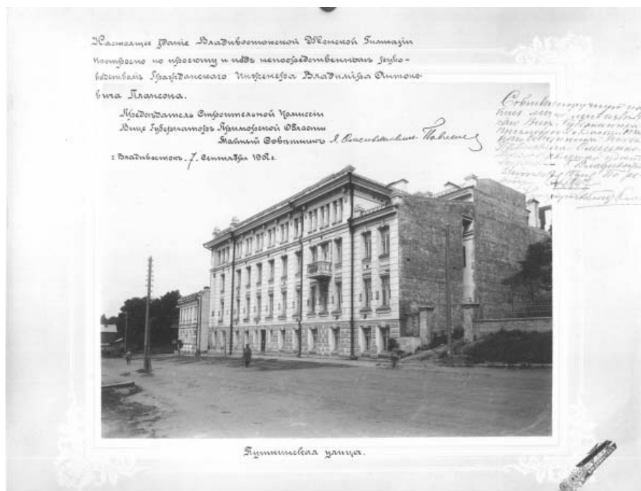
Здание женской гимназии. Пушкинская ул., Владивосток. МРК, США

частей: цоколя, основного поля и аттикового этажа. Цокольный этаж был обработан крупнофактурной штукатуркой и рустован, основное поле стены имело гладкую поверхность, окна второго и третьего этажей объединялись по вертикали в ниши и были обрамлены изящными тягами криволинейного профиля. Красиво выглядел центральный вход, а балкон в правой части фасада и арка въезда во двор в левой придавали зданию некоторую асимметричность и живописность.