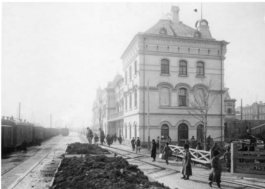
Железнодорожный вокзал. Алеутская ул., Владивосток.