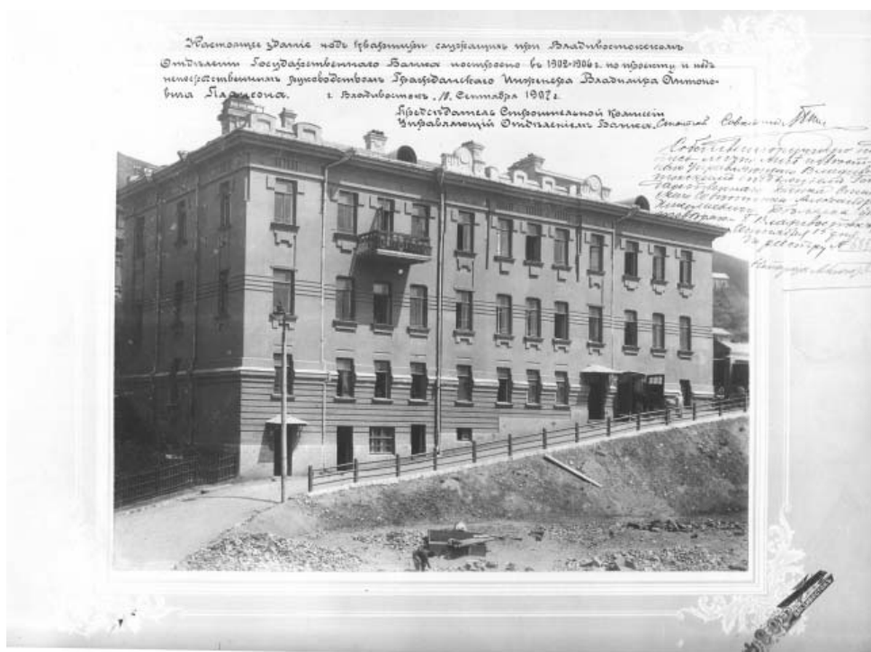
Общездание Государственного банка. Пушкинская ул., Владивосток. МРК, США

Известный русский журналист Всеволод Крестовский, побывавший в 1880 г. во Владивостоке, отметил: «Что особенно кажется странным, именно для русского глаза, это отсутствие заметных церковных глав и колоколни, на которых наши взоры искони привыкли останавливаться еще издали в каждом русском городишке, в каждом селении. Здесь вы гораздо прежде заметите совершенно приличную лютеранскую кирху, сооруженную на видном месте благодаря усердной заботливости адмирала Эрмана (бывшего губернатора Владивостока)...» 17 . История подтвердила замечание Крестовского: все основные православные храмы и соборы со временем были снесены, а лютеранская кирха и католический костел уцелели, правда, тоже изрядно заплатив по векселям беспамьятства.