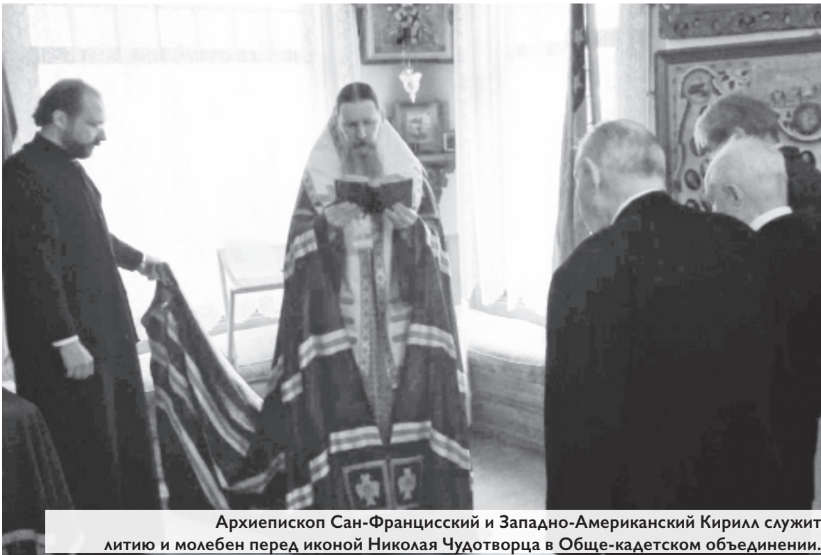
Архиепископ Сан-Францисский и Западно-Американский Кирилл служит литию и молебен перед иконой Николая Чудотворца в Обще-кадетском объединении.