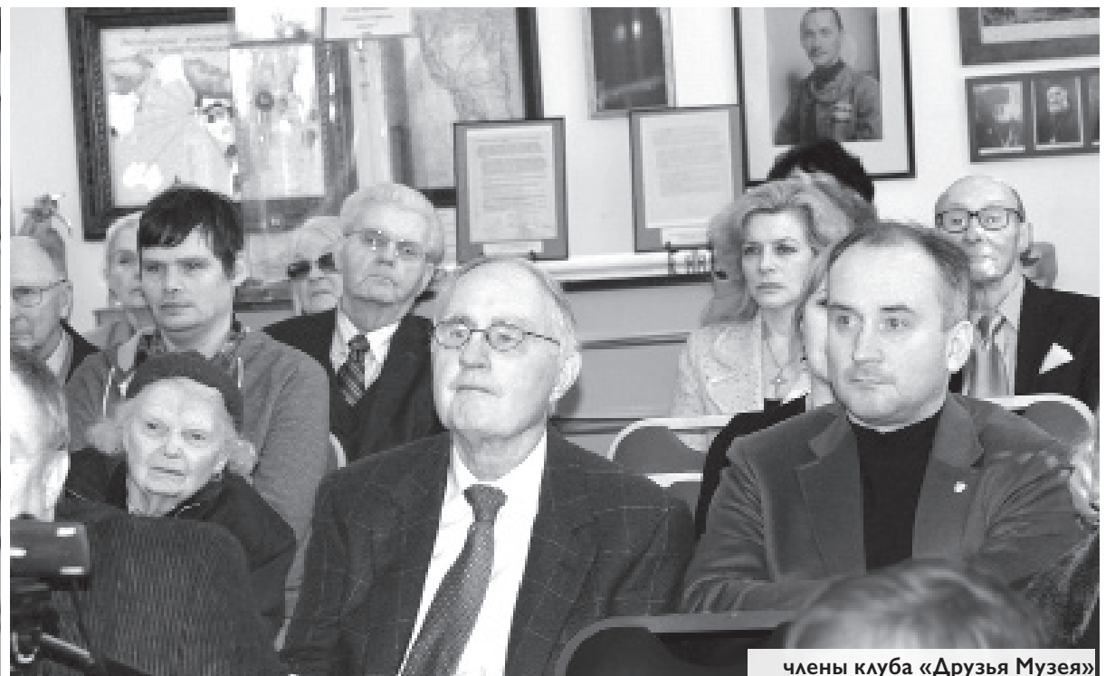
члены клуба «Друзья Музея»